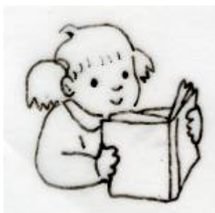
Lola lee un libro