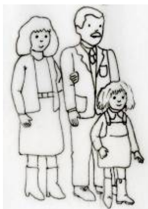
Lola sale con su familia