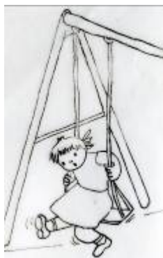
Lola se columpia sola