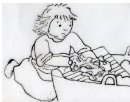
Lola lava la tela