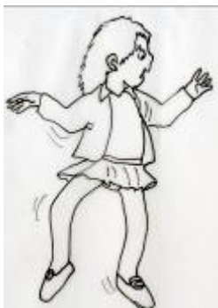
Lola baila sola