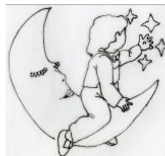
Luís vuela en la luna